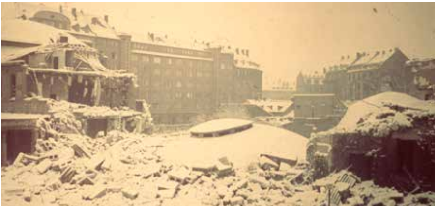
Die zerstörte Hauptsynagoge in der Hindenburg- straße

und dass sich niemand dem wütenden Mob, meist angeführt von SA-Führern oder NSDAP-Funktionären in Uniform oder Zivil, in den Weg stellte. Was aber hatte zu diesem – so die NS-Propaganda – „jäh aufwallenden Volkszorn“ geführt.