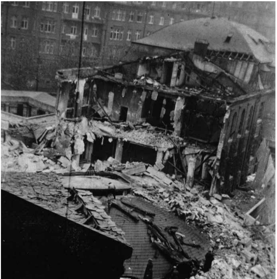
Die Mainzer Hauptsynagoge nach ihrer Sprengung am 17.11.1938